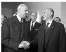
Charles De Gaulle et Konrad Adenauer